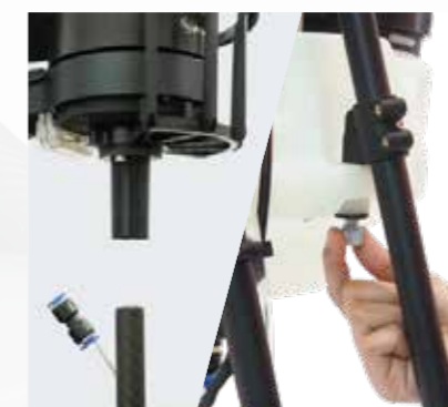
簡単脱着のノズル、タンクで 洗浄や交換の手間を軽減