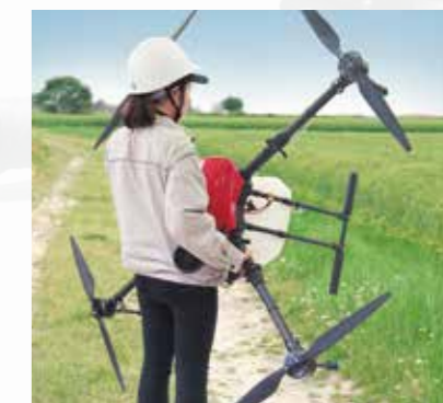
軽量ボディで、持ち運びや 調整も一人で楽々