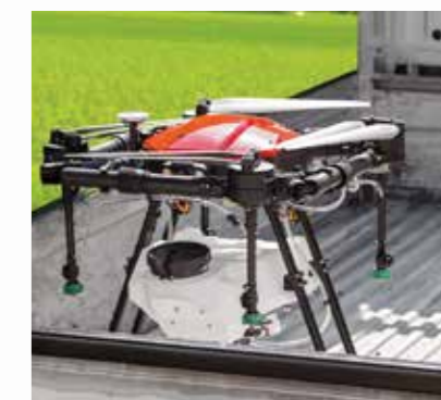
アーム・プロペラ折りたたみ でコンパクトに収納