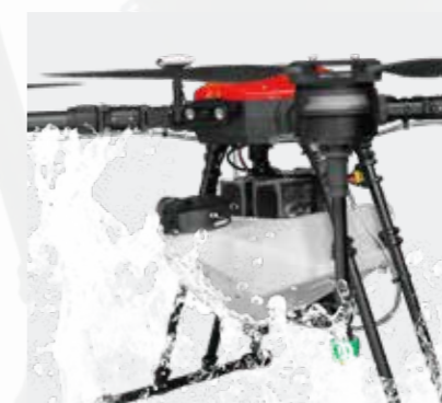
防水防塵仕様で 大事なメカ類の保護も万全