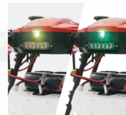
ランプの色で 機体の状態をお知らせ