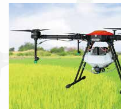
周辺環境に配慮したプロペラで 静音かつパワフルな飛行